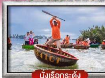
นั่งเรือกระดิง