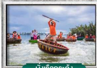
นั่งเรือกระดิง