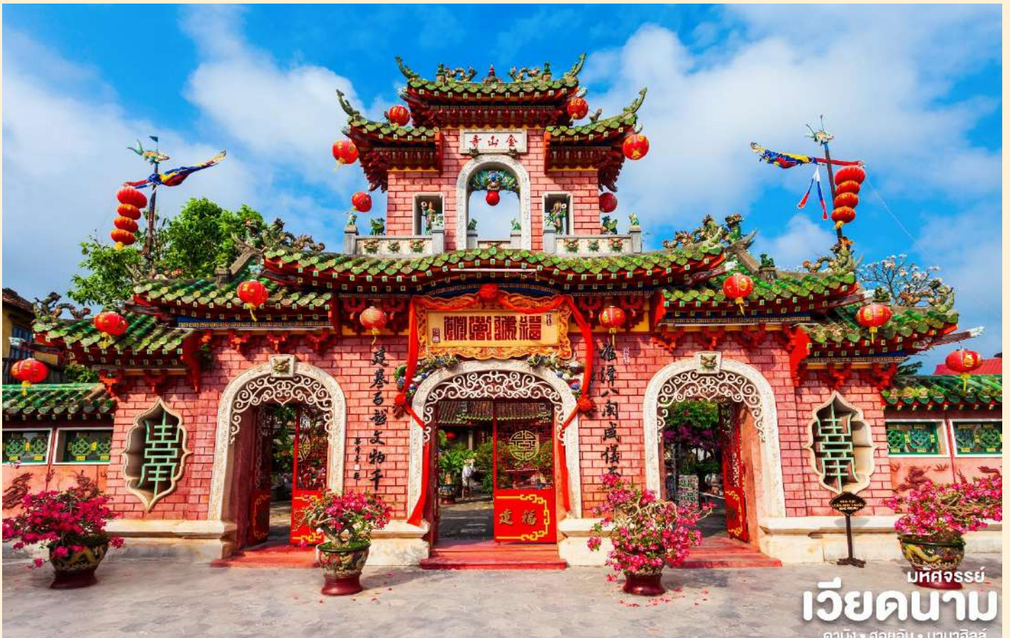
มหัสจรรย์ เวียดนาม ดานัง • ฮอยอัน • บานาฮิลล์

นำท่านชม วัดจีน เป็นสมาคมชาวจีนที่ใหญ่และเก่าแก่ที่สุดของเมืองฮอยอันใช้เป็นที่พักปะของคนหลายรุ่น วัดนี้มีจุดเด่นอยู่ที่งานไม้แกะสลักลวดลายสวยงามท่าน สามารถทำบุญต่ออายุโดยพิธีสมัยโบราณ คือ การนำรูปที่ขุดเป็นก้นหอย มาจุดทิ้งไว้เพื่อ เป็นสิริมงคลแก่ท่าน