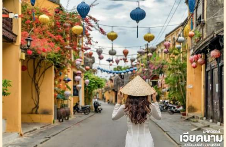
มหัสจรรย์ เวียดนาม ดานัง • ฮอยอัน • บานาฮิลล์

เมืองฮอยอันนั้นอดีตเคยเป็นเมืองท่า การค้าที่สำคัญแห่งหนึ่งในเอเชียตะวันออกเฉียงใต้และเป็นศูนย์กลางของการ แลกเปลี่ยนวัฒนธรรมระหว่างตะวันตกกับตะวันออกองค์การยูเนสโกได้ประกาศให้ฮอยอันเป็นเมืองมรดกโลกทางวัฒนธรรมเนื่องจากเป็นสถานที่สำคัญทางประวัติศาสตร์ แม้ว่าจะผ่านการบูรณะขึ้นเรื่อยๆแต่ก็ยังคงรูปแบบของเมืองฮอยอันไว้ได้