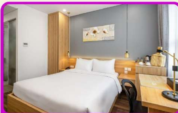
พักเมืองดานัง 4 ดาว 2 คืน