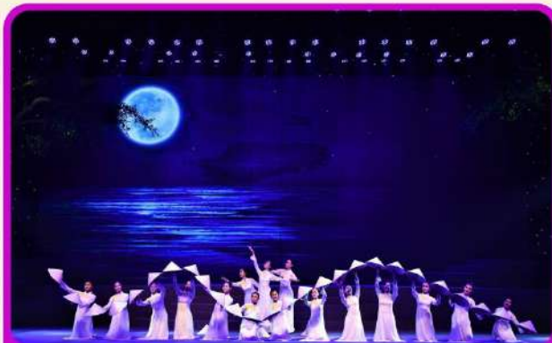
ชมการแสดง Charming Show Danang