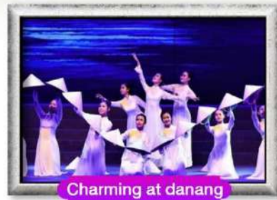
Charming at danang