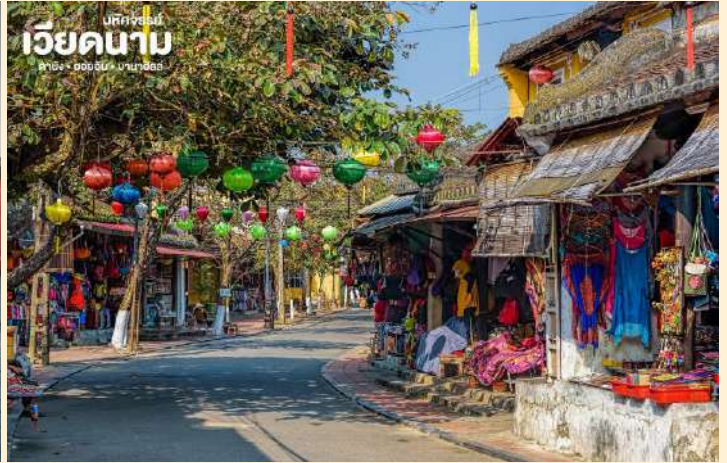
เบตจอร์จีย์ เวียดนาม ดานัง • ฮอยอัน • บานาฮิลล์

นำชม สะพานญี่ปุ่น ซึ่งสร้างโดยชุมชนชาวญี่ปุ่นเมื่อ 400 กว่าปีมาแล้ว กลางสะพานมีศาลเจ้าศักดิ์สิทธิ์ ที่สร้างขึ้นเพื่อสวดส่งวิญญาณมังกร ชาวญี่ปุ่นเชื่อว่า มี มังกรอยู่ใต้พิภพส่วนตัวอยู่ที่อินเดียและหางอยู่ที่ญี่ปุ่น ส่วนลำตัวอยู่ที่เวียดนาม เมื่อใดที่มังกรพลิกตัวจะเกิดน้ำท่วมหรือแผ่นดินไหว ชาวญี่ปุ่น