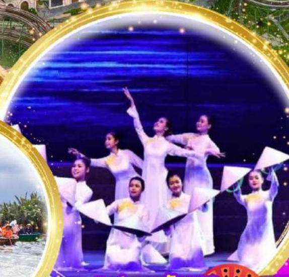
โชว์สุดอลังการ Charming at danang