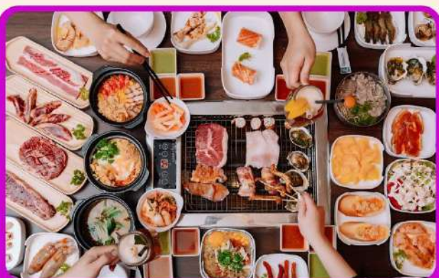
พิเศษ!! เมนูชาซีมี+บุฟเฟ่ต์ปิ้งย่าง