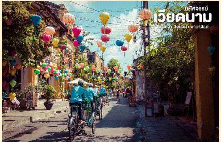
เบตจอร์จีย์ เวียดนาม ดานัง • ฮอยอัน • บานาฮิลล์

นำชม สะพานญี่ปุ่น ซึ่งสร้างโดยชุมชนชาวญี่ปุ่นเมื่อ 400 กว่าปีมาแล้ว กลางสะพานมีศาลเจ้าศักดิ์สิทธิ์ ที่สร้างขึ้นเพื่อสวดส่งวิญญาณมังกร ชาวญี่ปุ่นเชื่อว่า มี มังกรอยู่ใต้พิภพส่วนตัวอยู่ที่อินเดียและหางอยู่ที่ญี่ปุ่น ส่วนลำตัวอยู่ที่เวียดนาม เมื่อใดที่มังกรพลิกตัวจะเกิดน้ำท่วมหรือแผ่นดินไหว ชาวญี่ปุ่น