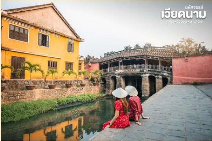
เบตจอร์จีย์ เวียดนาม ดานัง • ฮอยอัน • บานาฮิลล์