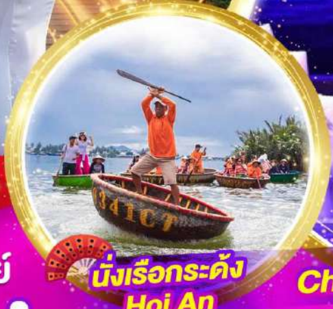
นั่งเรือกระด้ง Hoi An