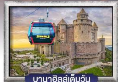
บาน่าฮิลล์เต็มวัน