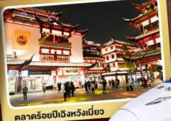
ตลาดร้อยปีเจิ้งหังเมี่ยว