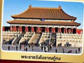
พระราชวังโบราณกู้กง