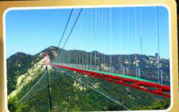
สะพานแขวนอ้ายจ้าย