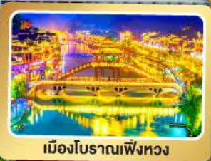
เมืองโบราณเฟิงหวง