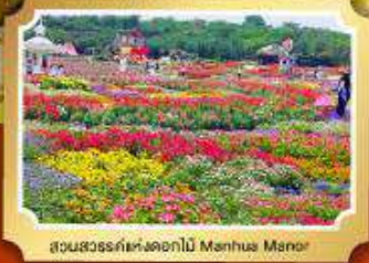
สวนสวรรค์แห่งดอกไม้ Manhua Manor