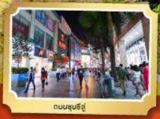
ถนนชุนชิว