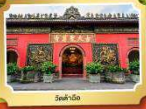
วัดต้ามื่อ