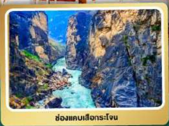
ช่องแคบเสีงกระเจิน