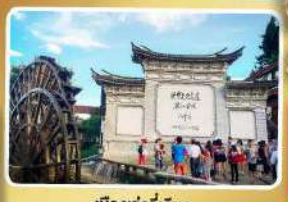
เมืองเกาลี่เจียง