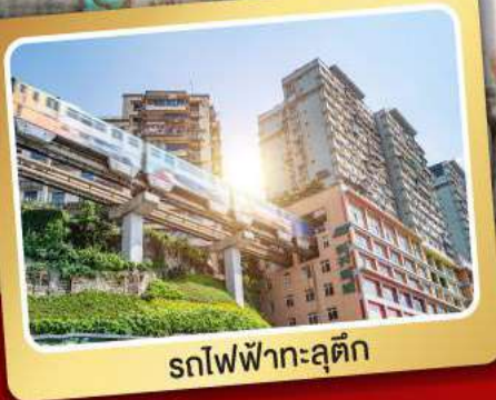
รถไฟฟ้าทะลุคึก