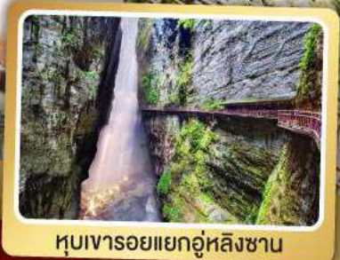
หุบเขารอยแยกอุ๋หลิงซาน