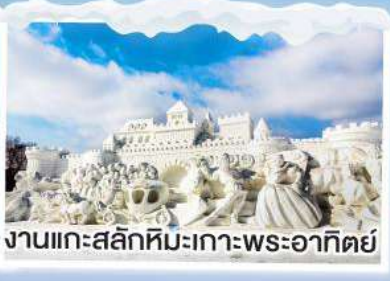
งานแกะสลักหิมะเกาะพระอาทิตย์