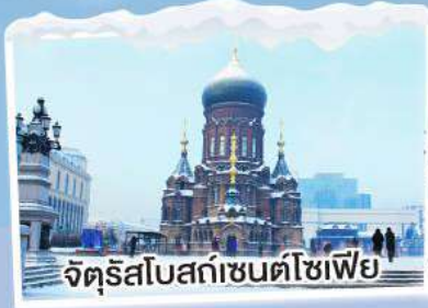
จัตุรัสโบสถ์เซนต์โซเฟีย