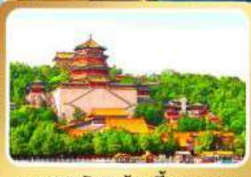
พระราชวังฤดูร้อนอี้เหอหยวน