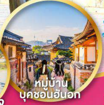
หมู่บ้าน บุคซอนอันอก

เทศกาล สงกรานต์ ชมความสวยงาม ของดอกซากุระ ที่สวนยอโด ใจกลางกรุงโซล