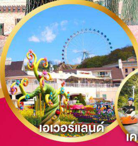
เอเวอร์แลนด์