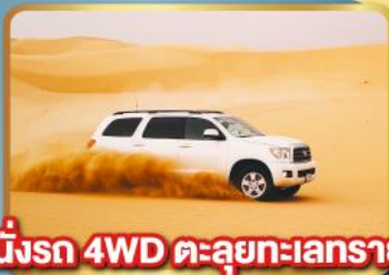
นั่งรถ 4WD ทะลุทะเลทราย