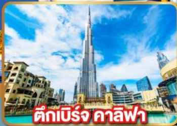
ตึกเบิร์จ คาลิฟา