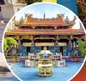
วัดหลงชา