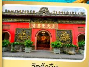
วัดต้าฉือ