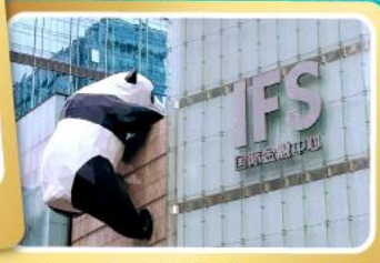
หมีแพนด้ายักษ์ป็นตึกถนนซูลซู่