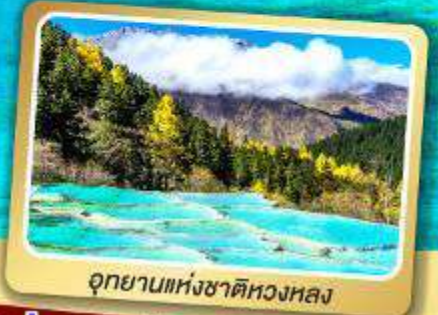
อุทยานแห่งชาติหลวงหลง