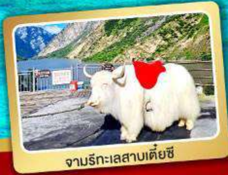
จามริกะเลสาบเตี้ยซี