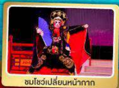
ชมโชว์เปลี่ยนหน้ากาก