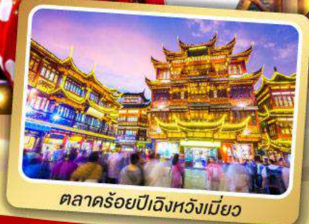
ตลาดร้อยปีเจียงหวงเมี่ยว