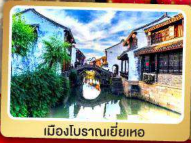
เมืองโบราณเหยี่ยเหอ