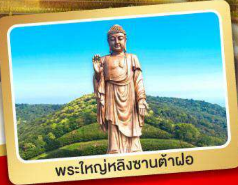
พระใหญ่หลังซานต้าผ้อ