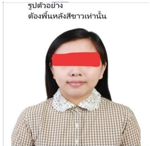
รูปตัวอย่าง ต้องพื้นหลังสีขาวเท่านั้น