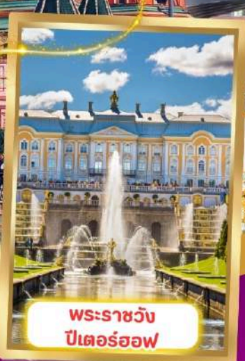
พระราชวัง ปีเตอร์ฮอฟ