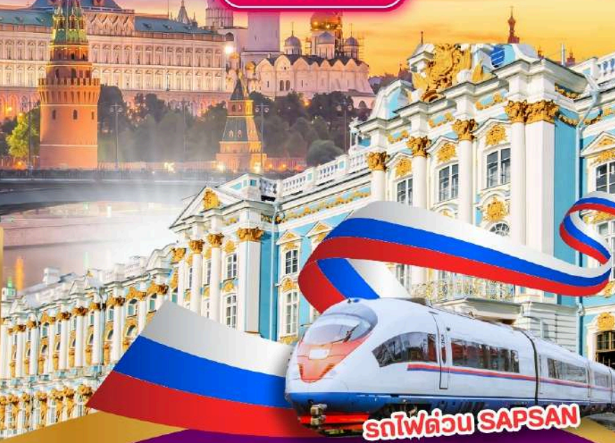
รถไฟด่วน SAPSAN