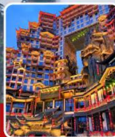
ตึก 72 ชั้น

อุทยานจางเจียเจีย เขาเทียนจื่อซาน สะพานหนึ่งในใต้หล้า ทะเลสาบเป่าเฟิงหู ตึกมหัศจรรย์ 72 ชั้น เมืองโบราณฟูหลงเจิน เมืองโบราณฟ่งหวง ล่องเรือแม่น้ำถิวเจียง สะพานสายรุ้ง ซ้อปิง ถนนคนเดินหวงซิงลู่