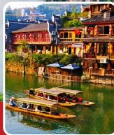
เมืองโบราณฟ่งหวง

เที่ยวฟิน 2 เมืองโบราณ พิชิตเขาวงกต แพนดอร่าของเมืองจีน