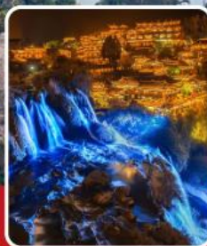
ฟูหลงเจิน