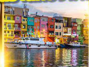
หมู่บ้านประมงเจิ้งปิน