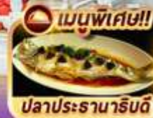
เมนูพิเศษ!! ปลาประจานาธิบดี