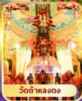
วัดต้าหลงตง