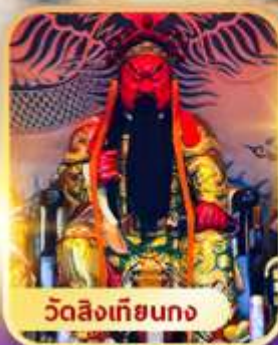
วัดลิงเกียตง