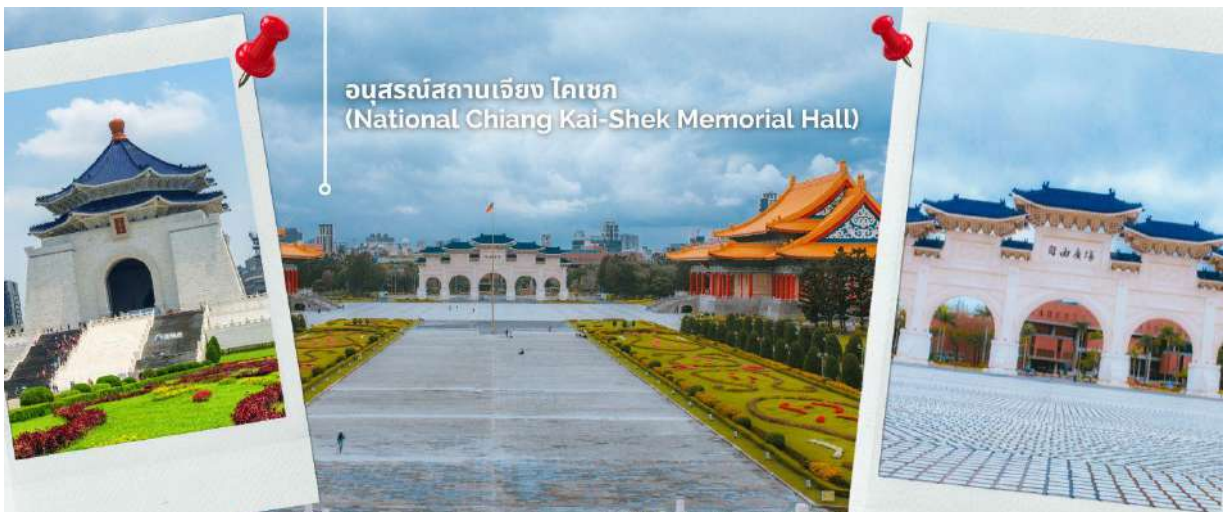
อนุสรณ์สถานเจียง ไคเช็ค (National Chiang Kai-Shek Memorial Hall)

นำท่านชม อนุสรณ์สถานเจียงไคเช็ค อนุสรณ์สถานที่ตั้งอยู่ตรงใจกลางของเมืองไทเปที่มีพื้นที่ 2,500 ตารางกิโลเมตรแห่งนี้ถูกตกแต่งและประดับเป็นอย่างดี โดยตัวอาคารของอนุสรณ์สถานถูกสร้างขึ้นมาตามแบบสถาปัตยกรรมจีนโบราณ บันไดทั้งสองด้านถูกสร้างด้วยหินอ่อนสีขาวเป็นขั้นตามแบบพีระมิดอียิปต์ หลังคาสีน้ำเงิน รวมทั้งยังมีสวนดอกไม้สีแดง ที่เป็นการแสดงออกทางสัญลักษณ์ให้เห็นถึงอิสรภาพ ความเท่าเทียม และความเป็นหนึ่งเดียวกัน ตามสีของธงชาติไต้หวัน