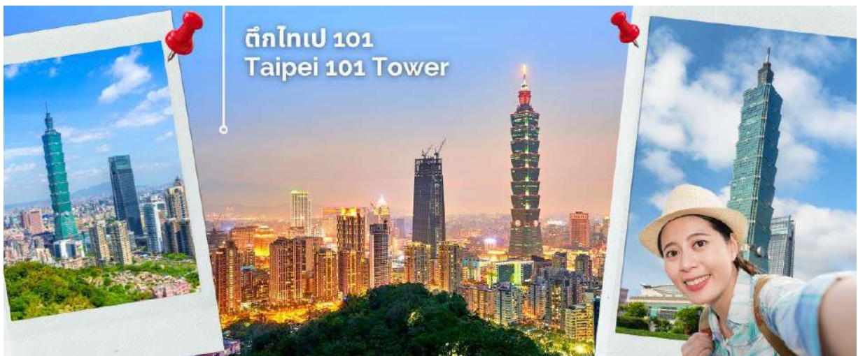
ตึกไทเป 101 Taipei 101 Tower

ก็ยังมีเทพเจ้าองค์อื่นๆตามความเชื่อของชาวจีนอีกมากกว่า 100 องค์ด้านในมาจากทั้งศาสนาพุทธ เต๋า และขงจื้อ เช่น เจ้าแม่ทับทิม ที่เกี่ยวข้องกับการเดินทาง,เทพเจ้ากวนอู เรื่องความซื่อสัตย์และหน้าที่การงาน และเทพเยว่เหล่า หรือ ผู้เฒ่าจันทรา ที่เชื่อกันว่าเป็นเทพผู้ก่อดำรงให้สมหวังด้านความรัก จากนั้นนำท่านถ่ายรูป ตึกไทเป 101 (ไม่รวมบัตรขึ้นชั้น 89) ตึกระฟ้าสูงที่สุดในมหานครไทเปและเป็นตึกที่สูงที่สุดในโลกในปี พ.ศ. 2,547-พ.ศ. 2,553 ตึก ไทเป 101 ได้รับรางวัล “ผู้นำการออกแบบพลังงานและสิ่งแวดล้อม” ตึก ไทเป 101 มีจำนวนชั้นทั้งหมด 101 ชั้น และ ชั้นใต้ดินอีก 5 ชั้น ชั้น 1-5 จะเป็นห้างสรรพสินค้า และร้านอาหารชั้นนำเช่น DIN TIA FUNG DIMSUM , ZARA . ROLEX , PANNERAI , DIOR , CHANEL ฯลฯ และ ภายในตึกยังมีลิฟต์ที่เร็วที่สุดในโลก โดย Guinness Book World Recordsระบุไว้ที่ความเร็ว 1,010 เมตรต่อนาที ใช้ชั้นจากชั้น 5 ไปยัง ชั้น 88 โดยใช้เวลาเพียง 37 วินาทีเท่านั้น