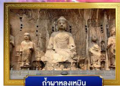
ถ้ำผาหลงเหมิน