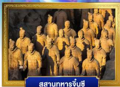
สุสานทหารจีนซี