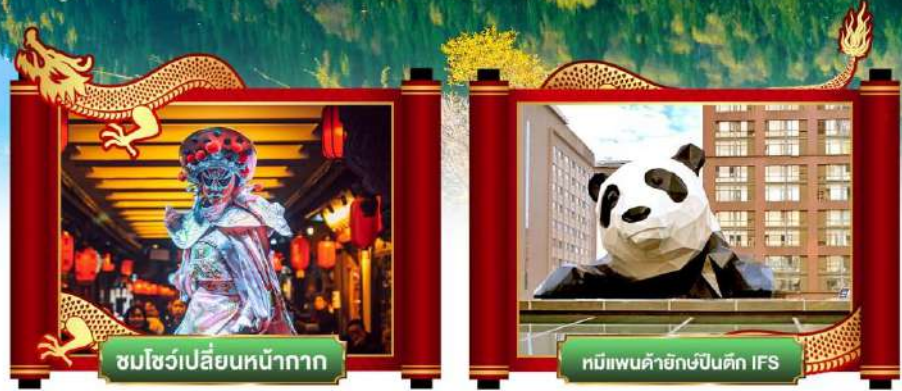
ชมโชว์เปลี่ยนหน้ากาก