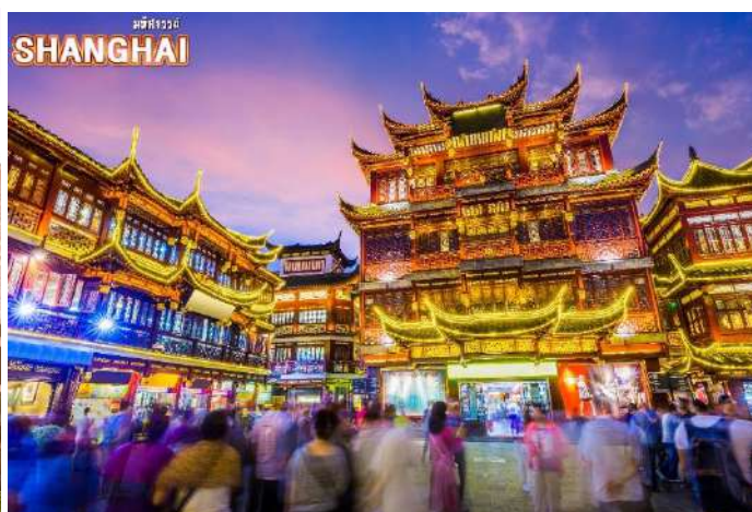
เมืองเซี่ยงไฮ้ SHANGHAI

ชมบรรยากาศของ ตลาดร้อยปีเจินหวังเหมียว ตลาดที่เก่าแก่ของเมืองเซี่ยงไฮ้ อาคารบ้านเรือนบริเวณนี้ มีสไตล์สถาปัตยกรรมแบบจีนโบราณที่ยังคงความงดงามเอาไว้ ทั้งร้านขายอาหาร ร้านขนมพื้นเมืองและร้านอาหารขึ้นชื่อ เมนูยอดฮิตที่ห้ามพลาด “เสี่ยวหลงเปา” อันลือชื่อ นอกจากนี้ยังมีขายของที่ระลึกต่างๆ อีกมากมาย