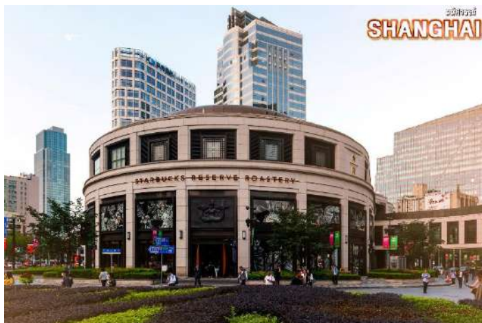
เมืองเซี่ยงไฮ้ SHANGHAI