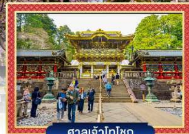
ศาลเจ้าโทโชกุ