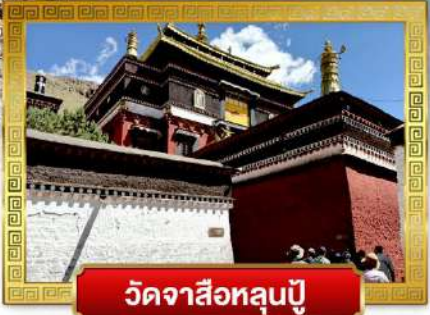
วัดจาซือหลุนปู้