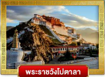
พระราชวังโปตาลา

เดินทางโดย: สายการบินบลูคิกเก็ตแอร์ (8L)