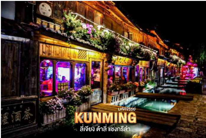
บึงคองฮง KUNMING สี่เจียง ต้าสี่ แซงกรี่ล่า