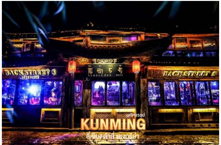
บึงคองฮง KUNMING สี่เจียง ต้าสี่ แซงกรี่ล่า

คำ ๑๐ บริการอาหารเย็น ณ ภัตตาคาร จากนั้น พักที่ FENG HUANG YANG SHENG / HAIYINGTING HOTEL หรือระดับเทียบเท่า ★★★★★