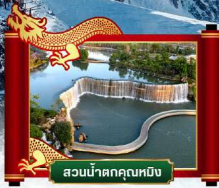
สวนน้ำตกคุนหมิง

✓ พิเศษ! โชว์จางอวี๋โหม่ว "ความประทับใจลี้เจียง"