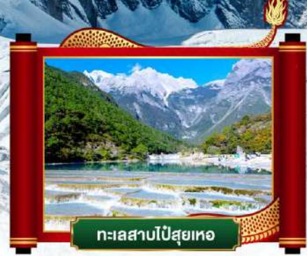
ทะเลสาบไป๋ซุยเหอ