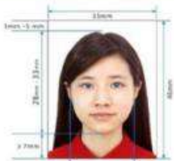
Paper Photo for Visa Application Form