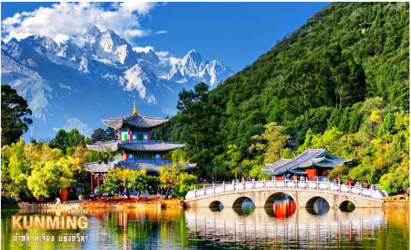
มณฑลยูนนาน KUNMING ตำบลลี่เจียง แขวงกรีสต้า