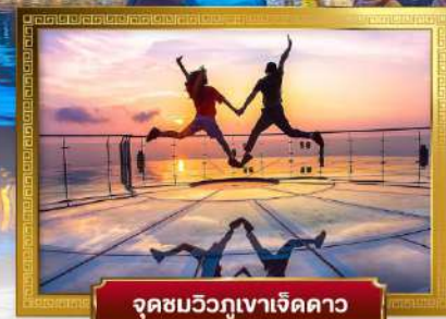
จุดชมวิวกุเขาเจ็ดดาว