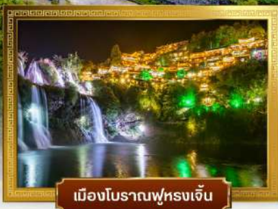
เมืองโบราณพูหลงเจิน