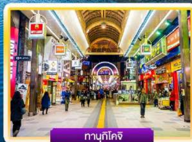
นาซากิโคจิ