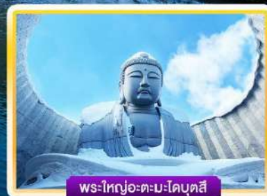
พระใหญ่อะตะมะโคบุตสึ