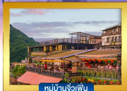
หมู่บ้านจิวเฟิ่น

พิเศษ !! บุฟเฟ่ต์ชาบูได้ทุกวัน , ปลาประจานาโรบิตี, เสี่ยวหลงเปา ,ไอศกรีม MIYAHARA