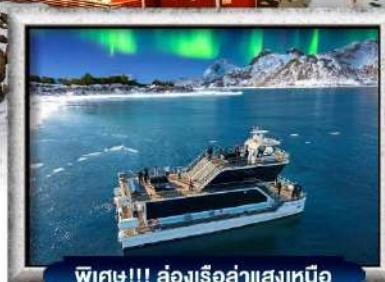
พิเศษ!!! ล่องเรือลำแสงเหนือ

บินทรู สายการบิน Full Service | พิเศษ! บุฟเฟต์ซีฟู้ด