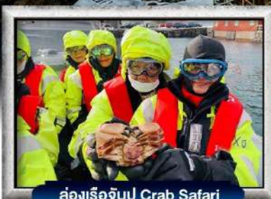
ล่องเรือจับปู Crab Safari