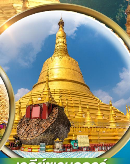
เจดีย์ชเวมอดอร์

สักการะ 3 มหาบูชาสถาน เจดีย์ชเวดากอง เจดีย์โบตาทาวน์ พระราชวังบุเรงนอง พระธาตุนครแวง