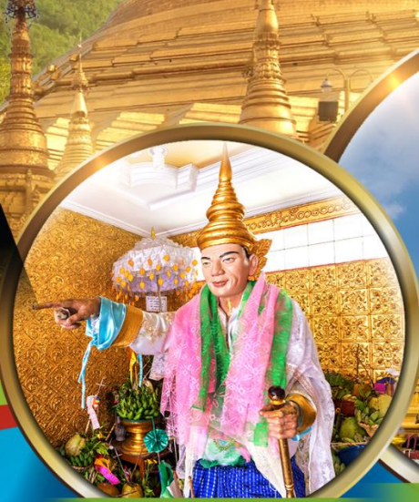
สักการะเทพทันใจ