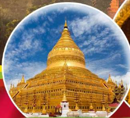
วัดเจดีย์ชเวดสิกอง