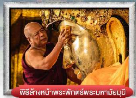
พิธีล้างหน้าพระพักตร์พระมหาเมย์มณี