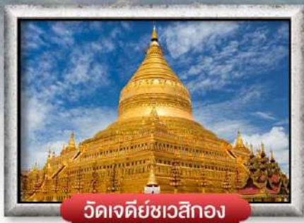
วัดเจดีย์ชเวสิกอง