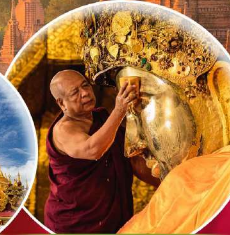
พิธีล้างหน้าพระ-พิกตร์พระ-มหาบิรมณี