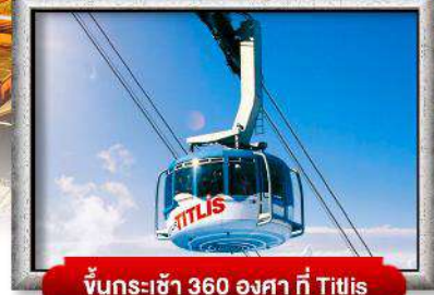
ขึ้นรถเช้า 360 องศา ที่ Titlis