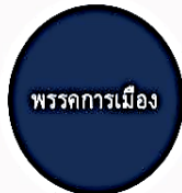
2. พรรคการเมือง