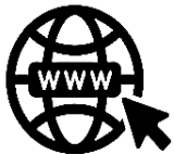
เว็บไซต์