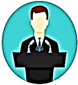
1. ผู้สมัคร