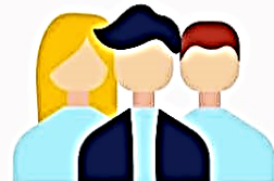
3. ผู้ที่มีได้เป็นผู้สมัคร

สามารถใช้วิธีการหาเสียงเลือกตั้งทางอิเล็กทรอนิกส์ได้ด้วยตนเอง หรือมอบหรือว่าจ้างบุคคลหรือนิติบุคคลดำเนินการแทนได้