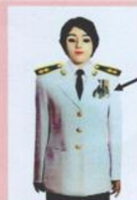
เครื่องแบบเต็มยศและครึ่งยศ

ประดับแพรแถบ เหรียญที่พระราชทานเป็นที่ระลึก ในโอกาสต่าง ๆ แบบบุรุษ ที่อกเสื้อเบื้องซ้าย