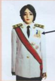
เครื่องแบบเต็มยศ

ประดับดารา ดวงตรา และสวมสายสะพายเช่นเดิม