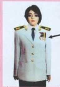
เครื่องแบบเต็มยศและครึ่งยศ (ประดับเครื่องราชอิสริยาภรณ์เหมือนกัน)

เช่น จ.ช., จ.ม., บ.ช., บ.ม., ร.ท.ช., ร.ท.ม., ร.จ.ช., ร.จ.ม.