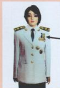
เครื่องแบบครึ่งยศ

เหรียญราชอิสริยาภรณ์ เช่น เหรียญจักรพรรดิมาลา เหรียญที่พระราชทานเป็นที่ระลึก ในโอกาสต่าง ๆ ให้ประดับโดยใช้แพรแถบ แบบบุรุษ