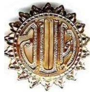
องค์การบริหารส่วนตำบล