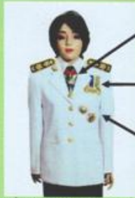
เครื่องแบบเต็มยศและครึ่งยศ (ประดับเครื่องราชอิสริยาภรณ์เหมือนกัน)

เช่น ท.ช., ท.ม. (เดิมประดับหน้าบ่าเสียมิดารา)