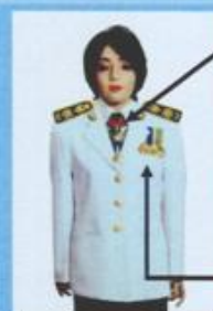
เครื่องแบบเต็มยศและครึ่งยศ (ประดับเครื่องราชอิสริยาภรณ์เหมือนกัน)

เช่น ต.ช., ต.ม. (เดิมประดับหน้าบ่าเสียมิดารา)