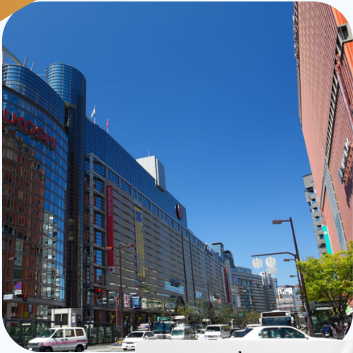
ซอปปิงเกินจิน