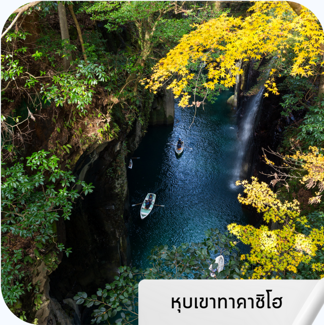
หุบเขากาคาชิโฮ