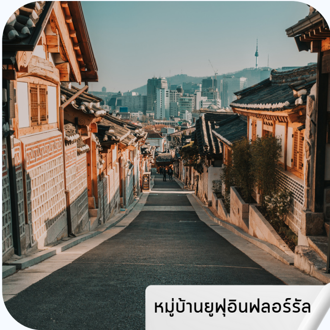
หมู่บ้านยูฟูอินฟลอร์ริล