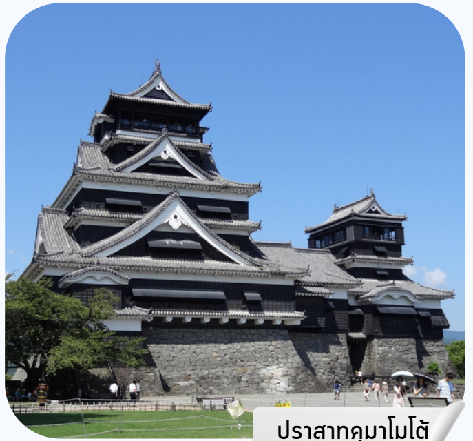
ปราสาทคุมาโมโตะ