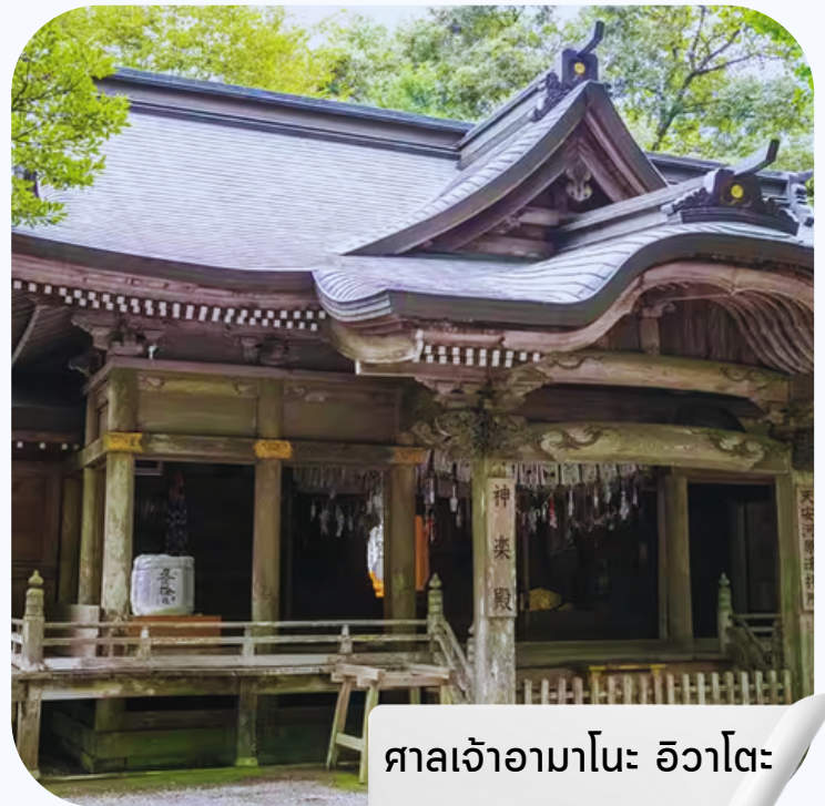
ศาลเจ้าอามาโนะ อิวาโตะ