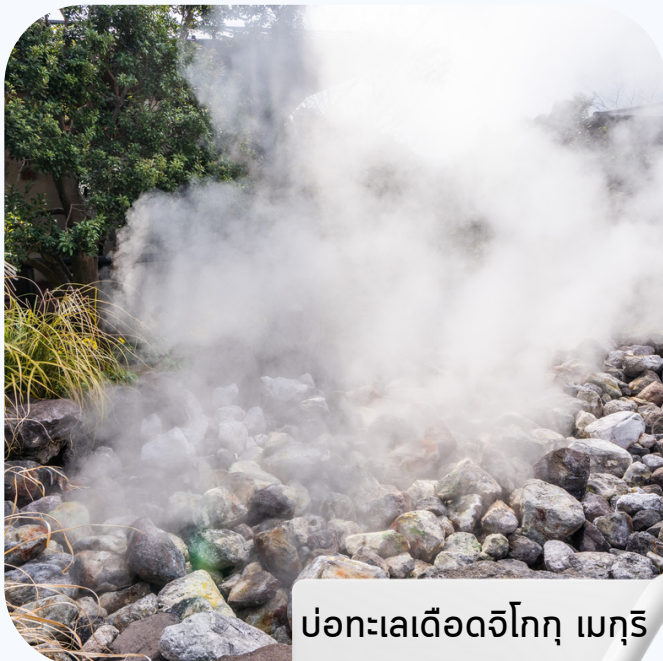
บ่อน้ำพุร้อนจิโงกุ เมกุริ