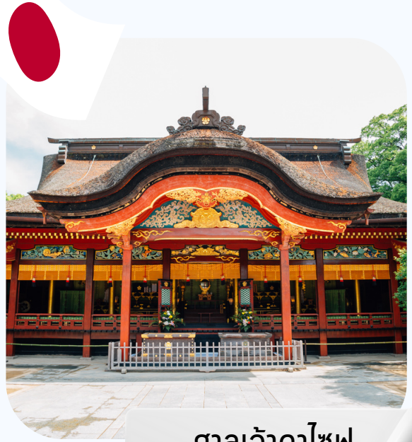
ศาลเจ้าดาไซฟู