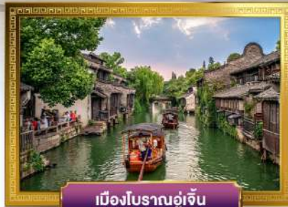
เมืองโบราณอู่เจิน