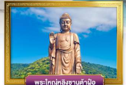
พระใหญ่หลิงซานต้าฝื่อ

พิเศษ!! เสี่ยวหลงเปา, ซึ่โครงหมูอู๋ซี, ไก่จอกานและหมูพันปี