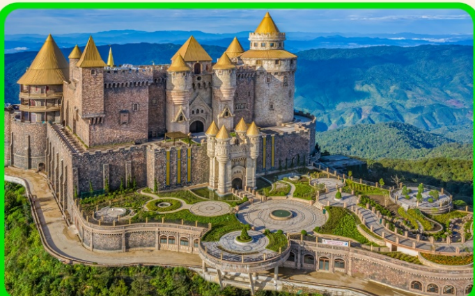
เที่ยวบานาฮิลล์แบบจุใจ เต็มวัน