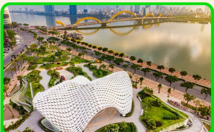
เช็คอน แหล่งที่เที่ยวยุคใหม่ APEC PARK