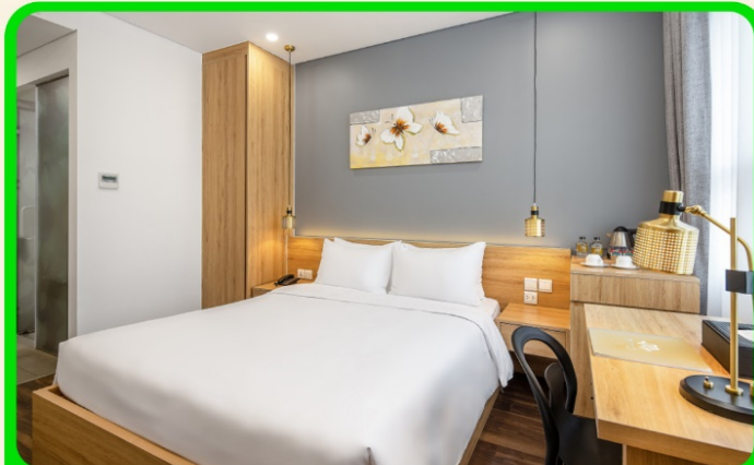
พักเมืองดานัง 4 ดาว 3 คืน