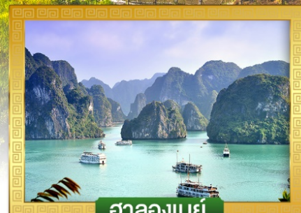
ฮาลองเบย์