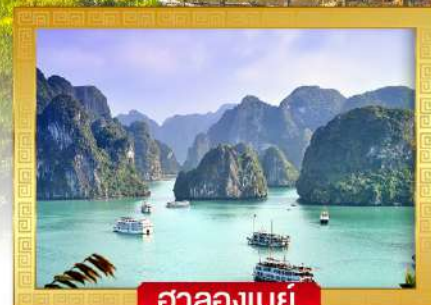
ฮาลองเบย์