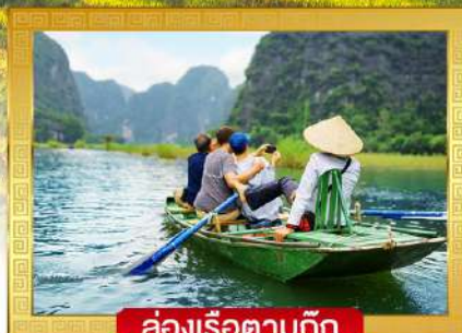
ล่องเรือตามก๊ก