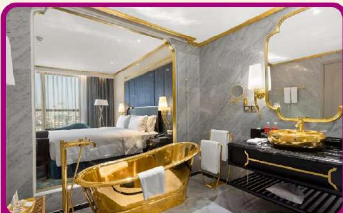
พัก Golden Lake 5 ดาว 1 คืน