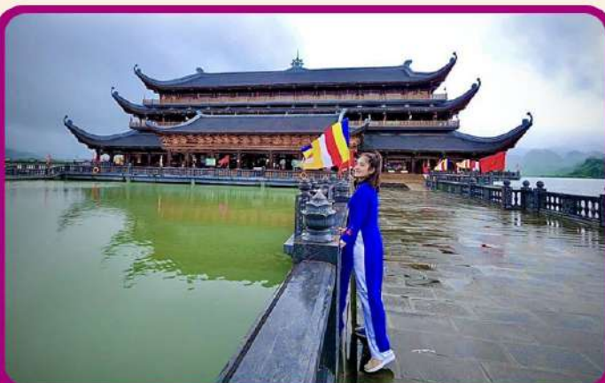
จุดเช็คอินแห่งใหม่ “วัดตามจุก”