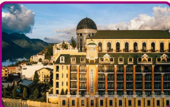
พัก Mgallery Sapa 5 ดาว 2 คืน