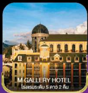
M GALLERY HOTEL โรงแรมระดับ 5 ดาว 2 คืน