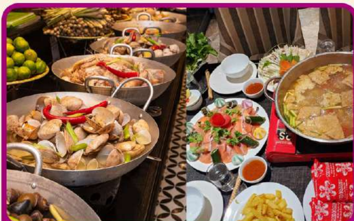
พิเศษ !!! บุฟเฟ่ต์นานาชาติ SEN BUFFET และ เมมูชาบูหม้อไฟปลาแซลมอน+ไวน์แดงดालัด