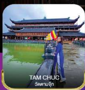
TAM CHUC วัดตามจุ๊ก