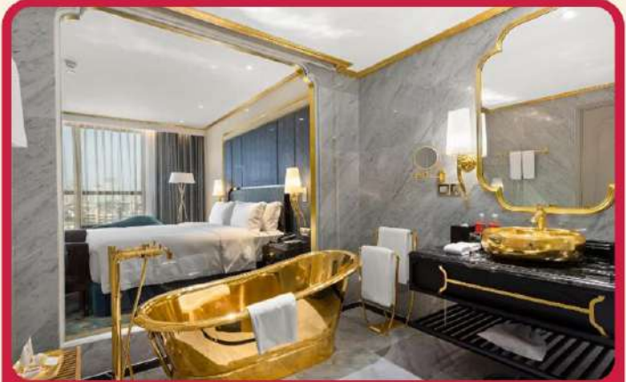
พัก Golden Lake 5 ดาว 1 คืน