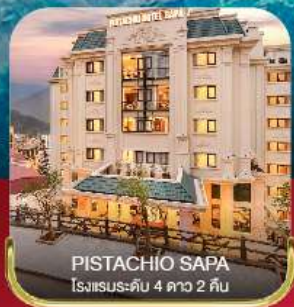
PISTACHIO SAPA โรงแรมระดับ 4 ดาว 2 คืน