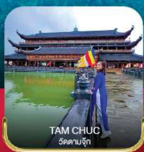
TAM CHUC วัดตามจุก