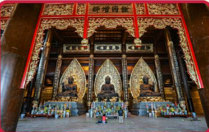
จุดเช็คอินแห่งใหม่ “วัดตามจุก”