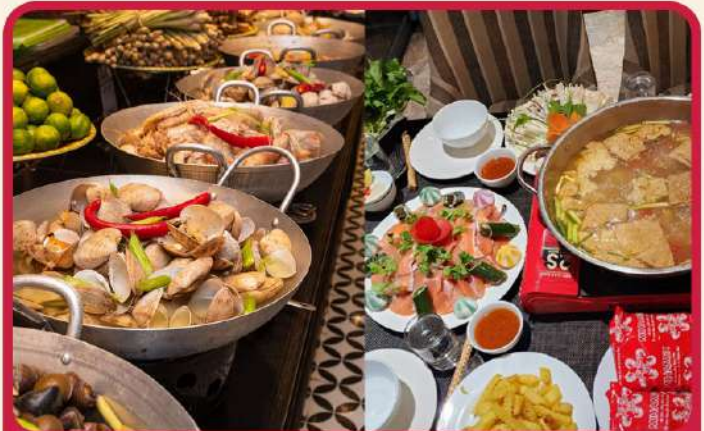
พิเศษ !!! บุฟเฟ่ต์นานาชาติ SEN BUFFET และ เมบูซาบุหม้อไฟปลาแซลมอน+ไวน์แดงดालัด