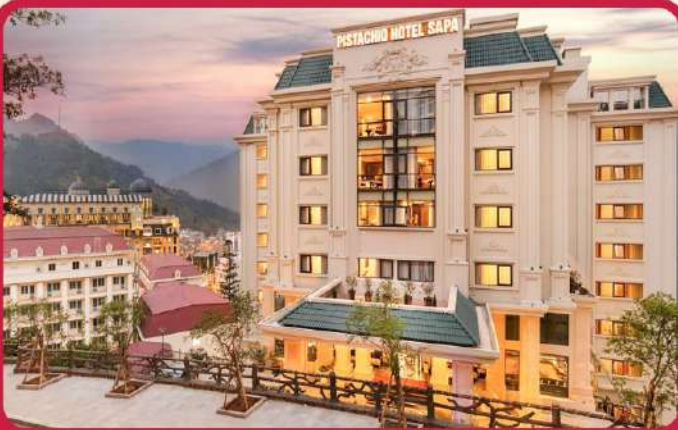
พัก Pistachio Sapa 4 ดาว 2 คืน