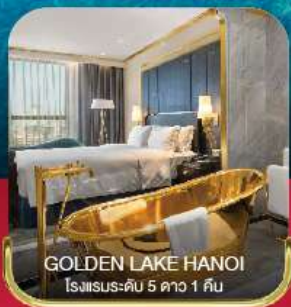
GOLDEN LAKE HANOI โรงแรมระดับ 5 ดาว 1 คืน