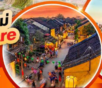
เมืองโบราณ Hoi an