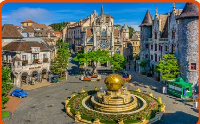
เที่ยวบานาฮิลล์แบบจุใจ เต็มวัน