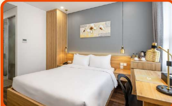
พักเมืองดานัง 4 ดาว 3 คืน