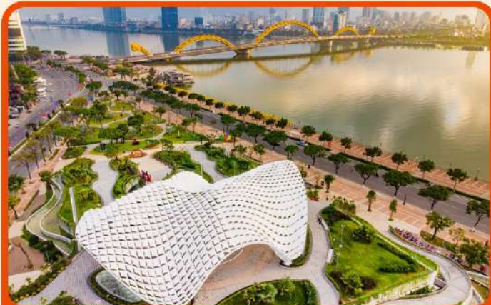
เช็किन แหล่งที่เที่ยงใหม่ APEC PARK