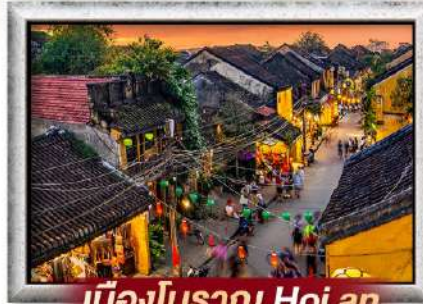
เมืองโบราณ Hoi an