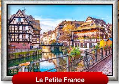
La Petite France