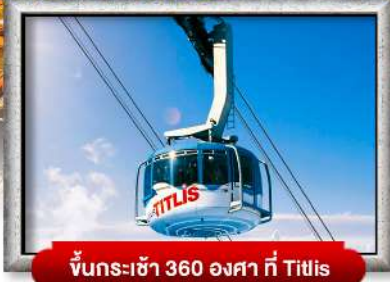
ขึ้นกระเช้า 360 องศา ที่ Titlis